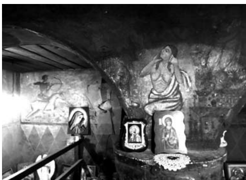
Fot. 21. Malowidła ścienna w części balkonowej – naga kobieta i jeździec