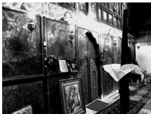
Fot. 19. Ikonostas – ujęcie na wprost