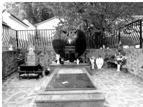
Fot. 14. Grób Stojny Dimitrowej