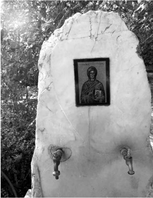
Fot. 6. Źródło z cudowną wodą

człowiek nie może go jednak całkowicie opuścić”, stwierdza Eliade 8 . To ambiwalentne doświadczenie jest charakterystyczne również dla najbardziej rozwiniętych form religijnych. W sferze doświadczania sacrum dokonuje się współcześnie szereg przemian. Klasyczne definicje sacrum , którego znaczenie zostało określone w pracy Rudolfa Otto oraz Eliade, zdają się nie przystawać do opisu współczesnej „nowej duchowości”. Tradycyjnie sacrum rozumiane jest jako coś transcendentnego, przekraczającego byt ludzki: „To, co przekracza człowieka, nie jest poza nim, nie jest źródłem mocy, nie wywołuje w człowieku uczucia tremendum . To ‘coś więcej’ nawet nie zawsze jest ponadnaturalne czy transcendentne. Jest immanentne, jest zadane do odkrycia i odpowiedniego przeżywania, trzeba się go w jakiś sposób nauczyć lub odkryć je w sobie” 9 . W ujęciu socjologicz-