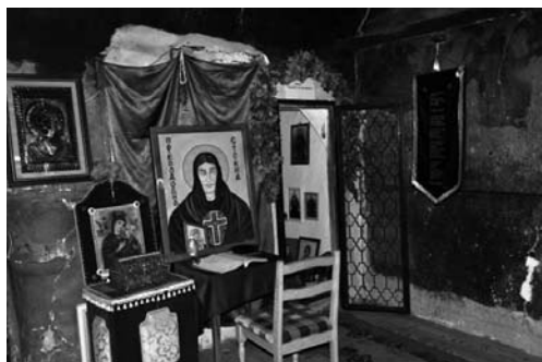
Fot. 2. Balkon, wejście do pokoju Stojny, zeszyt z modlitwami do Stojny

oddziaływać z daleka (fot. 4). W przed-sionku znajduje się zeszyt z modlitwami i prośbami do Stojny (fot. 2). Na balkonie świątyni można przenocować, korzystając z koców i poduszek ustawionych w sto-sach w tym celu. Charakterystyczną cechą balkonu są malowidła ścienne z półnągą kobietą i nietypowe przedstawienia dia-błów w scenach rodzajowych (fot. 18,19), wskazywane jako jedyne takie wyobraż-enia w chrześcijańskich świątyniach.