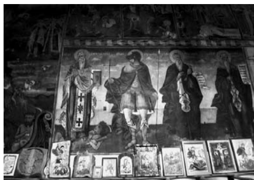
Fot. 16. Malowidła ściennie w nawie bocznej