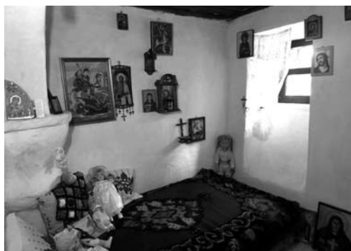
Fot. 3. Pokój Stojny