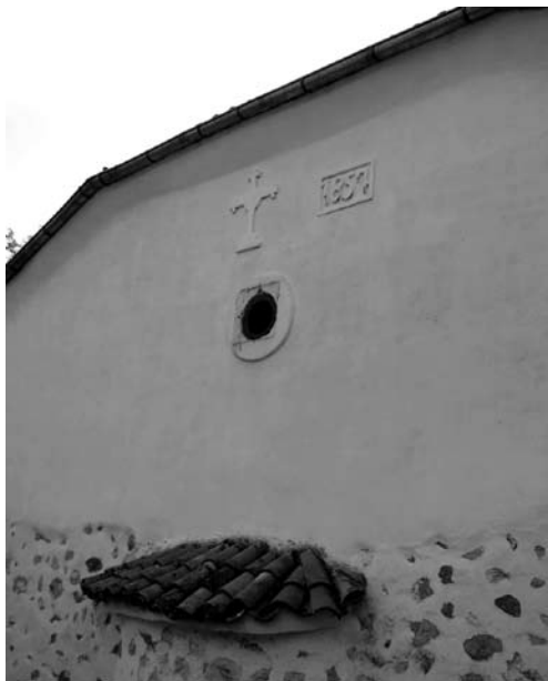
Fot. 7. Cerkiew św. Jerzego z datą budowy

Cerkiew św. Jerzego została zbudowana w 1857 roku (fot. 7–11), jeszcze za czasów Imperium Osmańskiego, na co