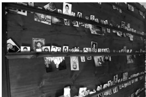
Fot. 4. Zdjęcia pielgrzymów na suficie pokoju Stojny