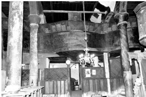
Fot. 10. Tylna część cerkwi z partią balkonową

wskazuje również fakt, że jej architektura odpowiada obowiązującym wówczas wytycznym dla chrześcijan – wewnątrz ma poniżej poziomu ziemi tak, by nie przewyższała bryłą minaretu 16 . Zgodnie z terminologią Pseudo-Dionizego Areopagity 17 , Bóg jest Hiper-Ikoną, a jego świątynia stanowi imago mundi , które jest omphalos , kosmicznym centrum o przestrzeni zabudowanej i uporządkowanej: „Mieszkanie Boga” miało być dla Bizantyńczyków porozumieniem „między naturalną skalą pierwiastków ludzkich a transcendentną skalą nieskończoności” 18 . Wszelkie symbole i obrzędy związane ze świątynią sprowadzają się ostatecznie do pradoświadczenia świętej przestrzeni – „Dzięki świątyni świat jako całość jest na nowo uświęcany. Jakkolwiek byłby nieczysty, nieustannie oczyszcza go świętość świątyni” 19 . Świątynia bizantyńska (a na takiej wzorowane są cerkwie prawosławne w Bułgarii), jest przesycona szczególną symboliką, wskazującą na oddzielenie przestrzeni sacrum od profanum przez ikonostas, którego carskie wrota uchylają jakby drzwi do raju w wybranych momentach liturgii i świąt. Ołtarz mieszczący się za tymi drzwiami jest zorientowany na wschód, ku Światłu Boskiemu, a nawa