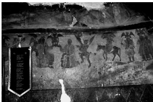
Fot. 20. Malowidła ścienna w części balkonowej – diabły w scenach rodzajowych