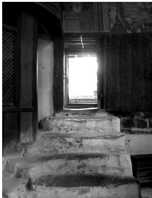
Fot. 8. Wejście do cerkwi