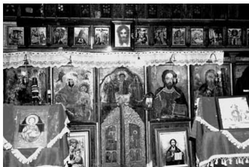
Fot. 18. Ikonostas – ujęcie z boku

Kult преподобnej (baby) Stojny i obzędowość z nim związana ujawnia swoje „mistyczne napięcie między Ja i Ty”, o którym pisze Rudolf Otto, zastanawiając się nad przeżywaniem „posiadania Boga”. Bazujące na tym „napięciu” „spotkanie” daje bodziec do rozczytywania „kodu” między bytem ziemskim (wiernymi Kościoła) i niebiańskim (Bogiem i jego reprezentantami na ziemi, w tym преподобną Stojną). W trakcie kontaktu między tymi dwoma sferami dochodzi również do uzwętrznienia się intuitius mysticus 7 , dzięki pośrednictwu i m.in. wierze w cuda преподобnej Stojny. Mircea Eliade zwraca uwagę na to, że człowiek wykazuje sprzeczne reakcje znajdując się w obliczu sacrum , które go pociąga i odrzuca zarazem: z jednej strony chce on nawiązać jak najbardziej „realny” kontakt z hierofaniami i kratofaniami, z drugiej obawia się definitywnej utraty owej „realności” przez swe zintegrowanie z płaszczyzną ontologiczną przerastającą jego świecki stan. „Pragnąc przekroczyć swój stan,