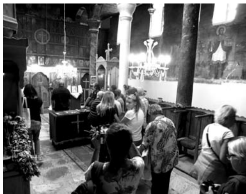
Fot. 12. Kolejka pielgrzymów do płytki marmurowej

Zwłaszcza podczas świąt wizyta w pokoju Stojny jest obowiązkowa. Wierni wpisują wtedy do specjalnych zeszytów modlitwy kierowane do uzdrowicielki, a także zostawiają zdjęcia swoje i bliskich z prośbą o wstawiennictwo. Niebagatelną rolę w rytuałach związanych z miejscem pełni dziedziniec cerkwi, gdzie znajduje się źródółko z cudowną wodą oraz ponad tysiącletnie drzewo, na którym zamontowane są drewniane huśtawki, z których chętnie korzystają kobiety, wierząc w ich