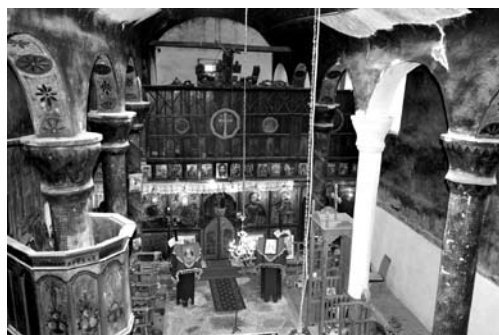
Fot. 11. Główna nawa cerkwi

ikon przynoszone przez wiernych. Na posadzce stoją również ikony kanoniczne, m.in. ikona św. Niedzieli i św. Paraskiewy-Petki. Ikonografia ścienna po przeciwnej stronie jest w dużym stopniu uszkodzona bądź nieczytelna z uwagi na zadyminienie. Ciekawa może być interpretacja przedstawienia po zewnętrznej stronie balkonu, na którym powtarza się motyw dwugłowego orła z marmurowej płyty. Ikonostas również uległ wpływom kultury ludowej – zarówno w rzeźbieniach, jak i w kwiatowych formach zdobień jego dolnej i górnej części. Rząd ikon świątecznych nad rzędem głównym stanowią ikony, które są zwykłymi nadrukami. Jednak rząd główny ikon to przynajmniej stuletnie dzieła wielkiego kunsztu, wykonane w sposób ortoikoniczny, zgodnie ze sztuką bizantyńską.