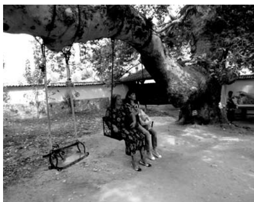
Fot. 15. Zabytkowy platan z huśtawkami