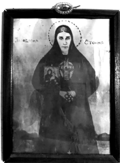
Fot. 1. Najstarszy zachowany portret Stojny