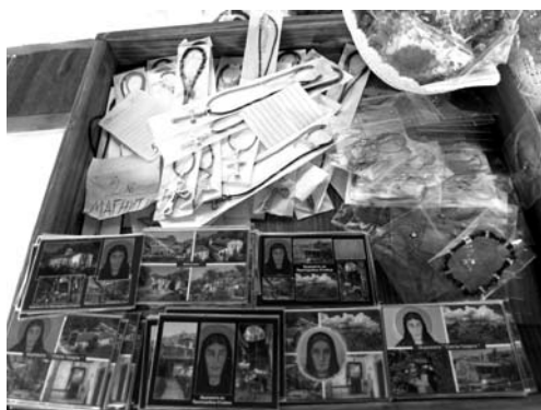
Fot. 5. Souveniry cerkiewne