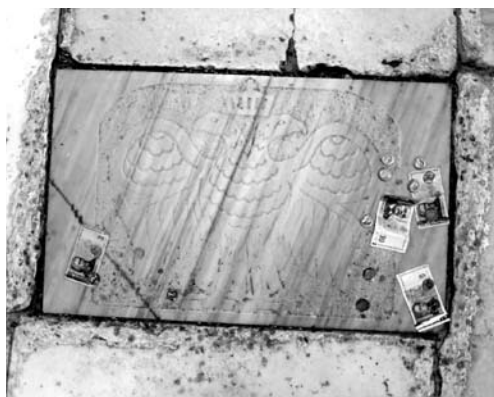
Fot. 13. Płytką marmurową z dwugłowym orłem – symbolem Patriarchatu Konstantynopolitańskiego